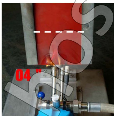
4 s – lángra kap az anyag