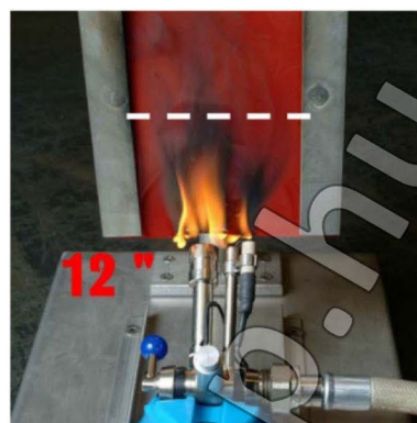
12 s – a lángmagasság határértéke (150 mm)