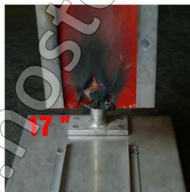
17 s – a láng kialszik