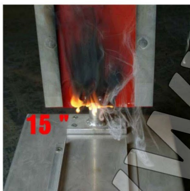
15 s – a láng csökkeni kezd