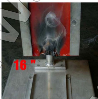
16 s – az anyag magába folytja a lángot